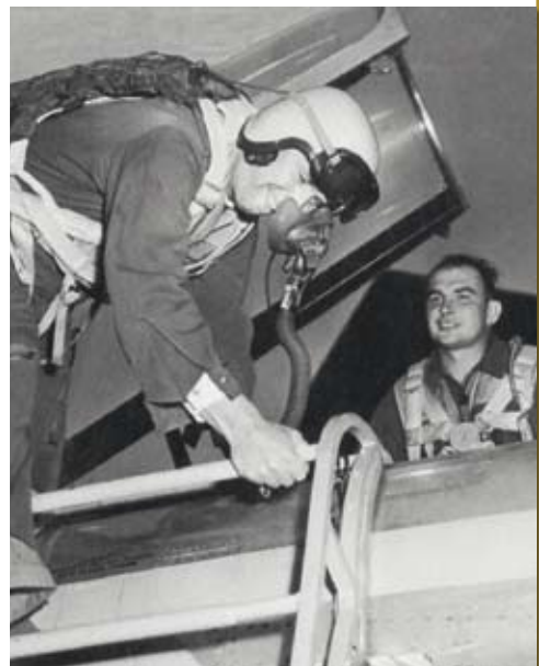
Hauges militære støttespillere kom i første rekke fra Luftforsvaret og Marinen. Hæren hang lenge igjen i ”nøytralistisk” tenkning. Her klyver Hauge om bord i et nytt jagerfly på Sola. Hauge satset målbevisst på en opprustning av flyvåpenet.