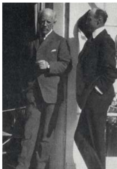
Kong Haakon og Fridtjof Nansen sto i en 25 år lang menneskelig og politisk allianse. Foto 1919.

Venstre ville torpedere Mellbyes mulighet til å danne regjering.