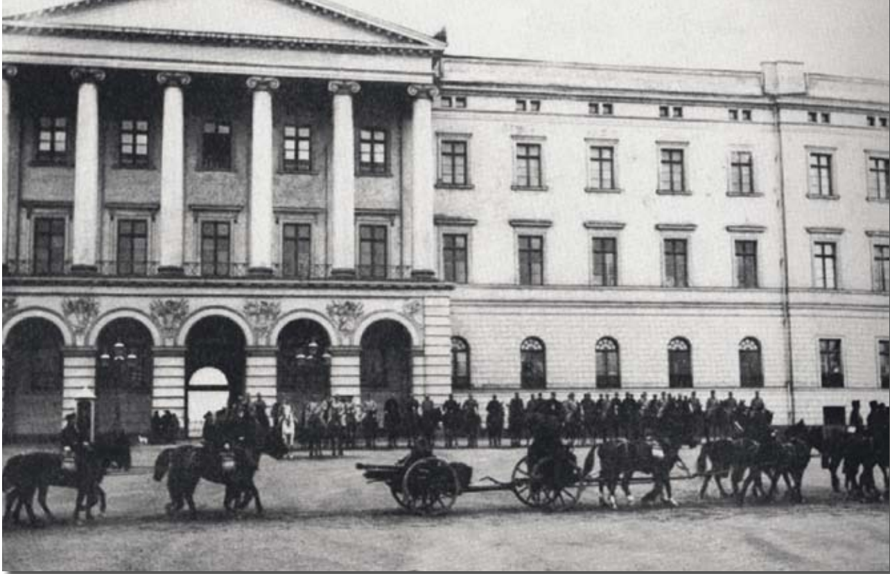
I oktober 1915 hadde militærparaden inntatt barnetogets enemerker. Kongen var anti-tysk, men fryktet samtidig at en for tyskvennlig norsk politikk kunne presse Storbritannia til aksjoner mot Kristiansand for å opprette et maritimt støttepunkt. Det vil tvinget Norge inn i krigen.

var å splitte arbeiderbevegelsen og å sluse ut de revolusjonære kreftene. Kong Haakon mente at selve regjeringsoppdraget kunne brukes til å nå dette målet.