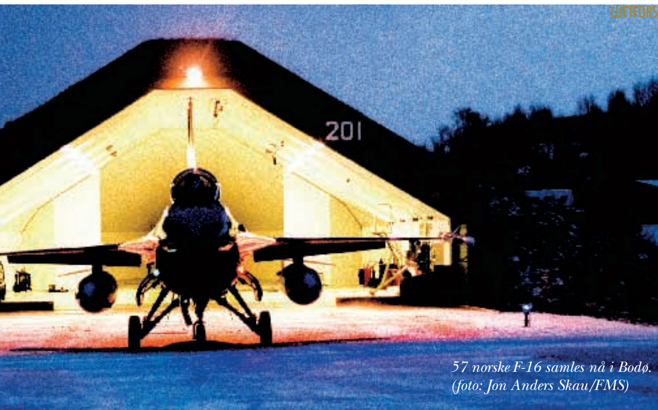
57 norske F-16 samles nå i Bodø.

ektefeller kan skaffe seg jobb i trygg forvisning om at her kommer de til å bli. Dette er et av de positive elementene, sier Rygg